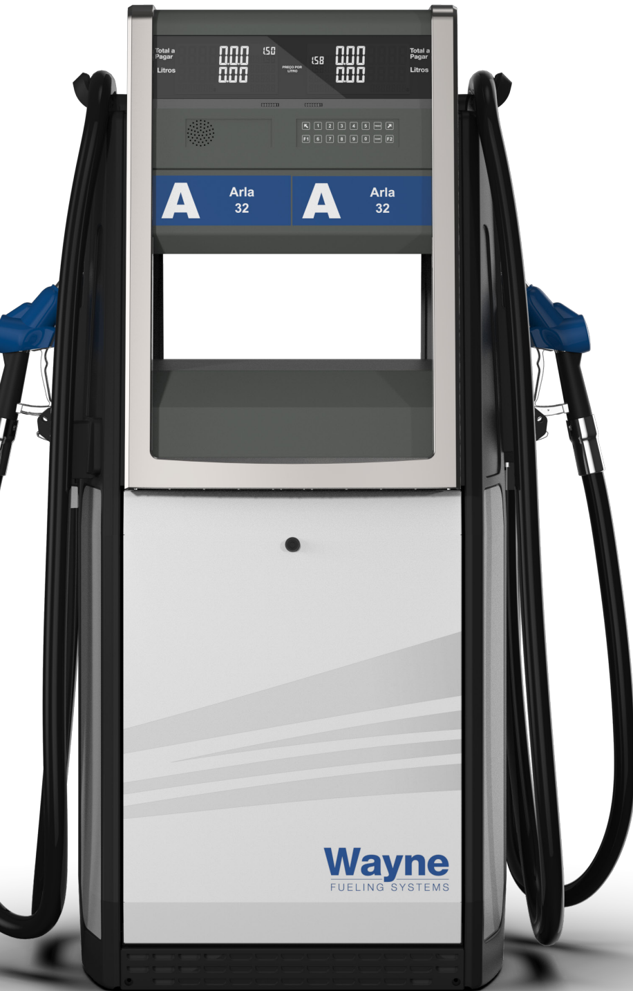
Bomba de Combustível Wayne Helix® 1000 Frota